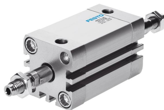
Afbeelding cilinder met doorlopende zuigerstang FESTO type Compacte cilinder ADN-32- -